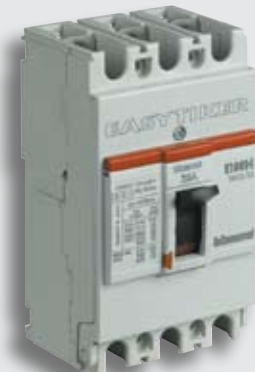
EASYTIKER E100B/N/H Mccb's

EASYTIKER is one of the world's more compact circuit breaker in its range. It is adapted to all your requirements and it can help you with both your local and international projects, offering every solution to: