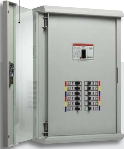
Glass door load center with main breaker

Movable hinges, reversible door เลือกเปิดได้สองด้าน (ซ้ายหรือขวา)