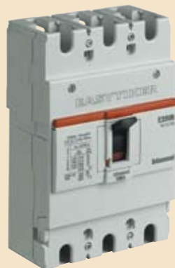
T6113/... T6123/... T6133/...

E250N - 3P - 25 Icu (kA) at 415V a.c. 600 Ue max (Va.c.)