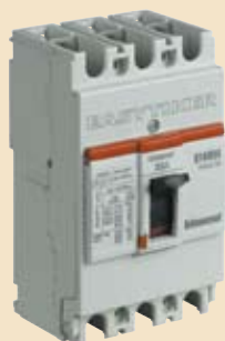
T6013/... T6023/... T6033/...