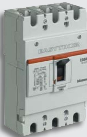
EASYTIKER E250B/N/H Mccb's